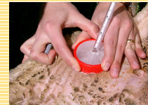
Mise en contact contre le plat de la cuisse des brebis, maintien et récupération des C. nubeculosus