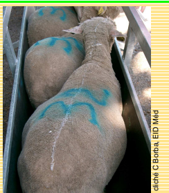
Brebis traitées avec du Butox® Pour-on.

Cinq lots de 3 brebis (âges et poids équivalents : 25 mois, 42 kg) ont été tondus 15 jours avant l'application. À différentes dates, 10 ml d'une solution pour-on de deltaméthrine (Butox® 7,5) ont été appliqués sur la ligne du dos de 12 des 15 animaux (4 lots traités, 1 lot témoin).