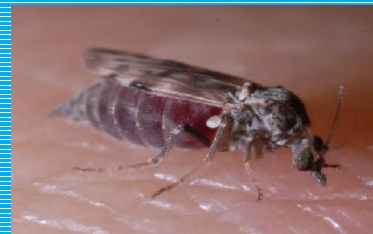
Femelle gorgée de C. nubeculosus

L'application de deltaméthrine en pour-on sur ovin (concentration théorique de 75 mg/m 2 ) n'a pas permis dans cet essai d'obtenir une protection individuelle totale contre les attaques de C. nubeculosus et n'induit qu'une mortalité modérée pendant moins de 13 jours. Avant toute extrapolation à l'espèce bovine, ces résultats doivent être confirmés.